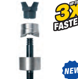
Saca-bocados SPEED PUNCH™