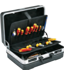
Mala de ferramentas profissional KL855B22, 22 un