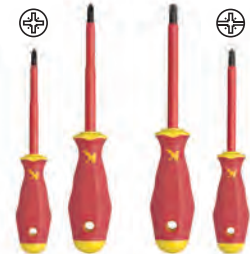
Chave VDE (PZ1/PZ2, PM1/PM2) Plus/Minus