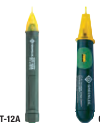
GT-12A e GT-16