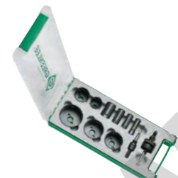
Estojo serra craneanas electro 52059295 SET