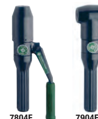
Bomba hidráulica Kwik Draw™ 7804E