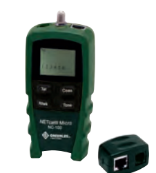
NC-100 Netcat verificador 52024541