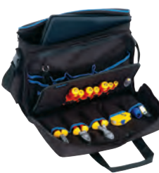
Mala ferramentas profissional KL905B15, 15 un