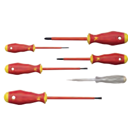
Kit de Electricista VDE KL390IS, 6 pcs