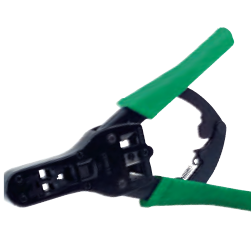
Alicate cravação fichas RJ 50455753