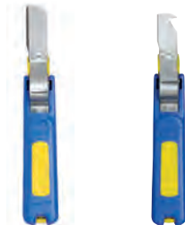
Navalha de Electricista com lâmina direita com gancho KL745GK KL745HK