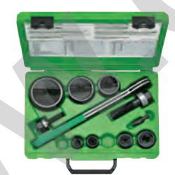
Estojo SlugBuster® ISO 16-63