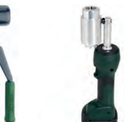
Bomba electro hidráulica LS 50 FLEX