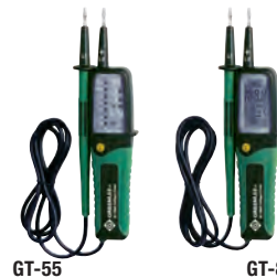
Verificador de tensão GT-55 e GT-85