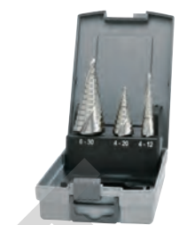
Broca cônica 50069900