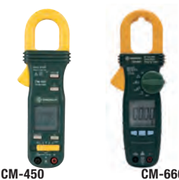
Pinça amperimétrica True RMS CM-450 e CM-660