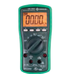
Multímetro digital DM-200A