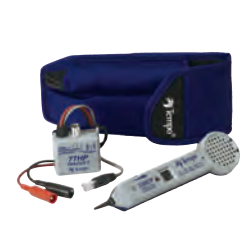
Detector pares e gerador de tons 50605041 (701K-G)