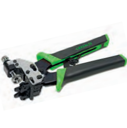
Alicate cravação coaxial SealTite® ProM PA1559