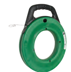
Guias de aço MagnumPRO™