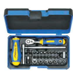
Estojo completo pontas 1/4 KL361, 28 un