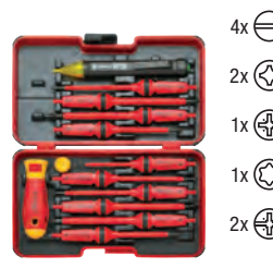
Conjunto KL301IS, 13 un