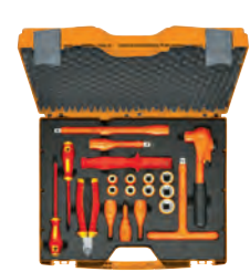
Estojo isolado 1/2 KL1300IS12B20, 20 un